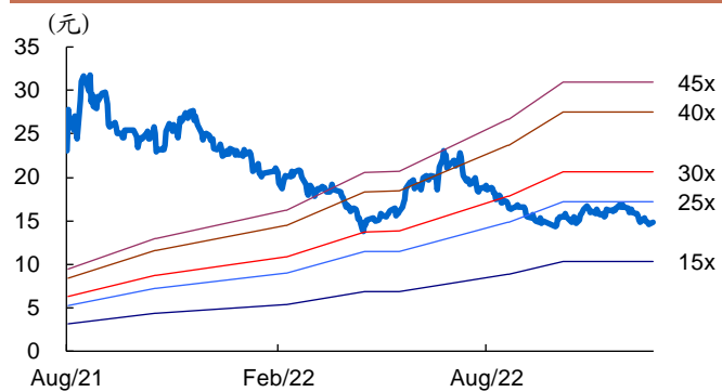
图 1: 长远锂科历史 PE Band