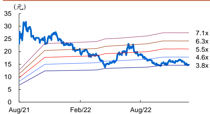
图 2: 长远锂科历史 PB Band