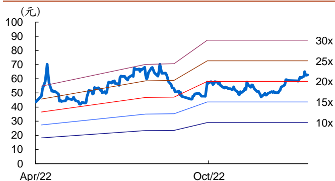
图 2: 永泰运历史 PE Band

我们认为公司持续受益于：1) 化工物流行业安全监管趋严，有利于已经受到市场认可的、具有稳定的安全运营历史的、专业的头部企业；2) 公司立足于经济活跃、需求旺盛的华东地区，在宁波港已形成规模优势，持续拓展全国其他地区，市占率有望快速提升；3) “运化工”平台优势整合下游中小客户，且具有自有仓储资源，未来仓储面积有望持续增长。我们预计公司 2022-24 年归母净利润分别为 3.2/4.4/5.9 亿元。基于我们的盈利预测，公司目前股价对应 21/15/11 倍 2022-24E P/E，维持公司“强烈推荐”评级。