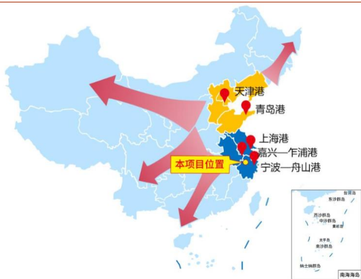
图 1: 标的资产地理位置优越

1) 标的资产地理位置优越，毗邻嘉兴、杭州、宁波等地区，交通条件便利，可高效连接宁波港、乍浦港、上海港等国内重要港口，随着公司永港海安仓储资源利用率已趋于饱和，收购绍兴长润有利于满足跨境化工物流供应链服务业务对危化品仓储资源日益增长的迫切需求;