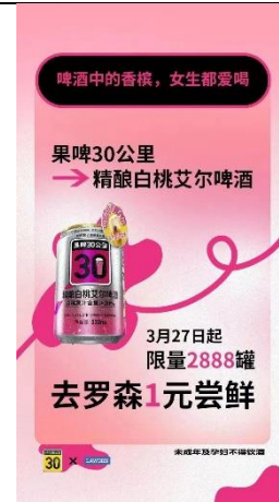
图 6：“鲜啤 30 公里”入驻罗森便利店