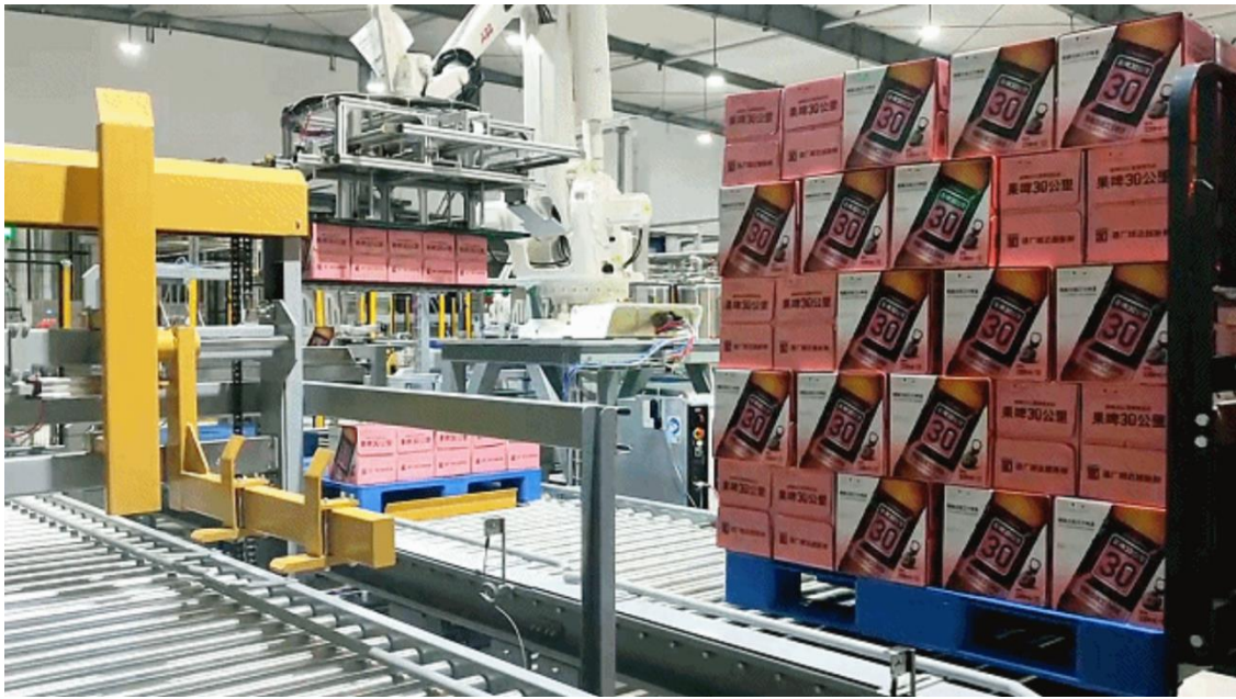
图 7：长沙鲜啤 30 公里酒厂