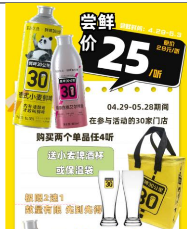
图 2：“鲜啤 30 公里” 联名重百优选