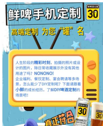
图 3：“鲜啤 30 公里” 定制罐业务