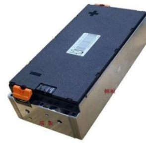
图 2：动力电池模组结构示意图