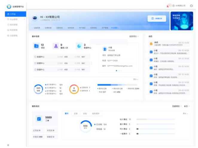
图4: 金微蓝 AI 运维专家——客户服务