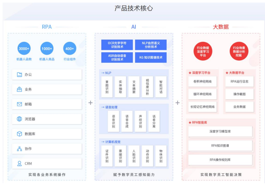
图1: RPA+GPT 构成广阔的落地应用场景