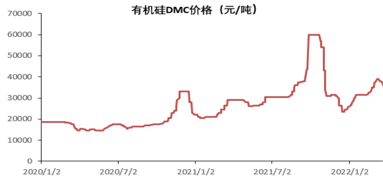
图表 1：有机硅价格走势