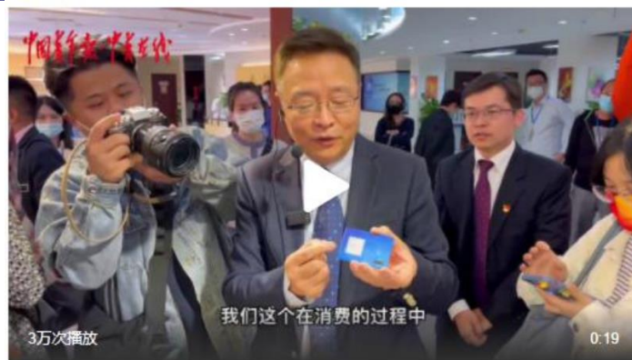
图表 2：数字货币硬钱包

数字货币硬钱包的单价为 100 元左右，优点在于离线无网络也可支付。一个可比的数据是银行卡，根据《中国普惠金融指标分析报告(2020年)》，中国的人均银行卡数量为 6.34 张。考虑其作为零钱包的使用属性更强，假设人均数字货币硬钱包为 1 张，则市场大概为 1300 亿元。