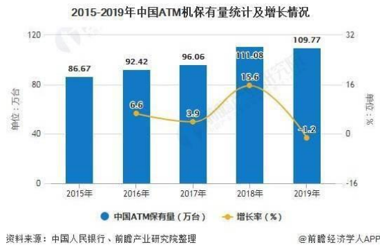
图表 1：ATM 保有量情况

根据我们的草根调研，目前数字货币出纳机的单价约在 4 万元左右，应用场景包括银行网点、商场、火车站等，可以认为基本与 ATM 的数量大体相同。ATM 的存量大概在 100 万台，因此数字货币出纳机市场大概为 400 亿元。