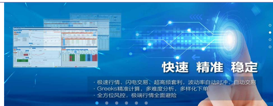
图表 5：钱育科技的期权策略交易系统