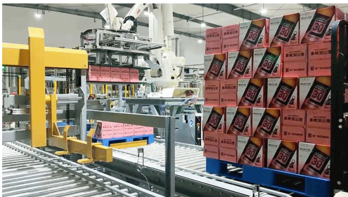
图 3：长沙鲜啤 30 公里酒厂