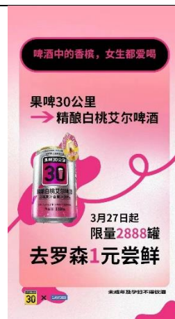
图 2：“鲜啤 30 公里” 入驻罗森便利店