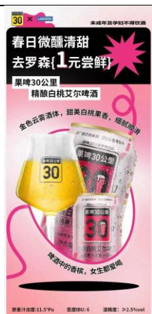
图 1：“鲜啤 30 公里” 入驻罗森便利店