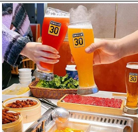
图 3：“鲜啤 30 公里” 入驻巴邑火锅