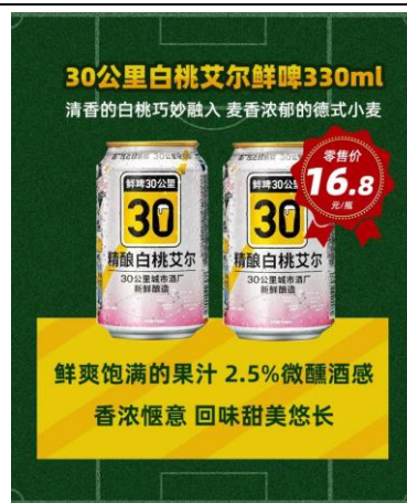
图 4：“鲜啤 30 公里” 入驻新佳宜