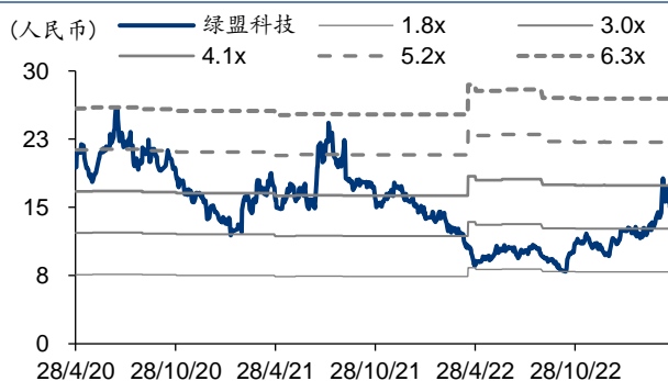
图表5: 绿盟科技 PB-Bands