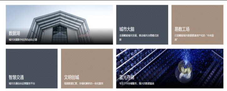
图2：易华录热门产品与解决方案