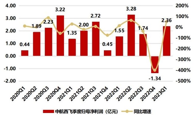
图2: 2023Q1 归母净利润为 2.36 亿, 同比增长 52.38%