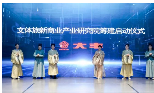
图 2：文体旅新商业产业研究院筹建启动仪式