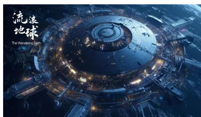
图 4：大丰文化牵手《流浪地球》