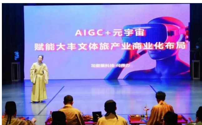
图 1：新商业战略发布及合作伙伴分享

活动现场，大丰正式发布以科技驱动的新商业布局和路线图，通过整合各方资源、协同发展产业链条，聚焦新场景和产业应用融合。在本次发布会上，大丰还举行了文体旅新商业产业研究院筹建启动仪式，此举在推动文体旅产业融合方面具有重要意义。发布会展示了大丰在人工智能等新技术变革背景下的战略布局，彰显了公司紧随全球数字经济大潮、践行国家“文化自信”的决心和能力。