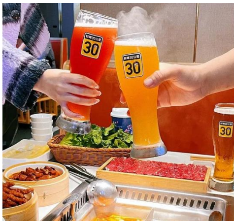
图 1：“鲜啤 30 公里”入驻巴邑火锅