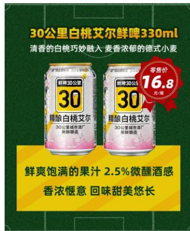
图 2：“鲜啤 30 公里”入驻新佳宜