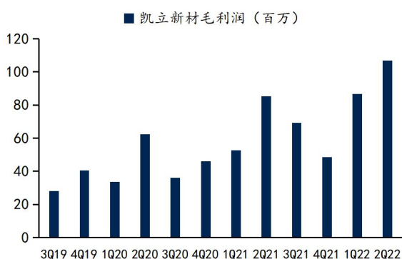
图3：凯立新材毛利润

业务多点开花，收入平稳增长，利润水平新高。 上半年公司贵金属催化剂销量进一步增长，其中医药、基础化工、农药领域收入增长率分别为 28.2%、44.1%、12.9%。上半年贵金属价格季度均价同比变化不显著，公司收入季度间有所波动的原因或是产品结构变化，从毛利润水平来看，公司二季度毛利润达到 1.07 亿，同比进一步增长。公司保持高研发费用，二季度研发投入 1408 万元，财务费用有所下降，其余科目波动不大，二季度盈利创历史新高。