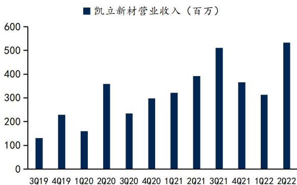
图1：凯立新材营业收入及同比增速

凯立新材披露 2022 年中报。2022 年上半年营业收入 8.47 亿，同比增长 18.8%，实现归母净利润 1.28 亿，同比增长 54.8%；其中二季度营业收入 5.33 亿，同比增长 36.1%，实现归母净利润 0.73 亿，同比增长 35.0%。