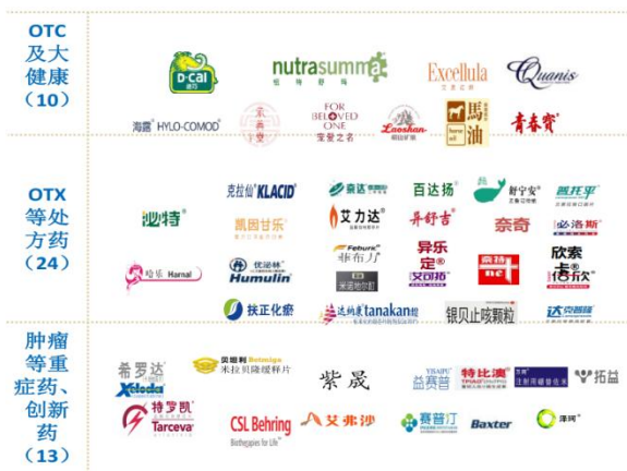
图表1：百洋品牌运营产品矩阵

公司上半年品牌推广业务持续保持高增长，实现营业收入 16.98 亿元，同比增长 31.12%，若还原两票制后计算，品牌运营实现营业收入 22.80 亿元，同比增长 46.20%，实现毛利额 7.98 亿元，毛利额占比达 80.40%，是公司的主要利润来源。CSO 业务高速增长的主要动力来自于新签品种的快速增加，2021 年公司新增运营品牌辉瑞制药的希舒美、阿斯泰来的适加坦、卫喜康、贝坦利、CSLBehring 的安博美、罗氏制药的希罗达和特罗凯，2022 年 2 月，新增签约上海谊众“注射用紫杉醇聚合物胶束”，新产品增量贡献较大。分品类来看，上半年 OTC 产品销售 11.25 亿元，同比增长 30.7%；处方药 OTX 销售 7.4 亿元，同比增长 43.73%；肿瘤创新药 4.16 亿，同比增长 128.02%，创新药 CSO 是公司增长的主要动力，百洋作为专业的第三方医药商业化运营平台，符合医药行业产业链的分工不断细化的产业发展趋势，长期市场前景良好。