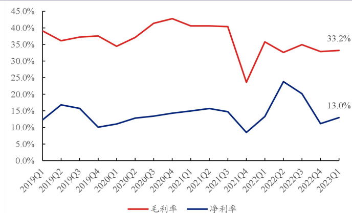
图 3、福耀玻璃分季度毛利率及净利率