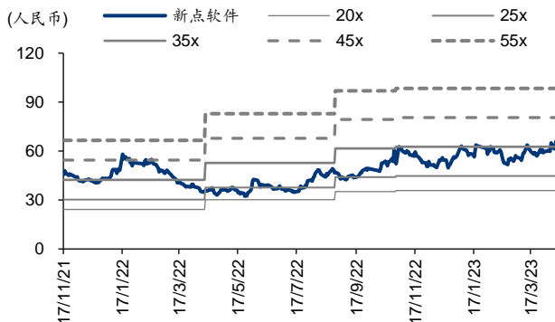
图表3: 新点软件 PE-Bands

数字建筑产品推进不及预期。 若数字建筑产品遭遇较为激烈的市场竞争, 或产品无法满足客户需求, 推广情况不及预期, 可能导致公司收入增长不及预期。