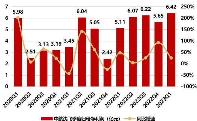
图1：据测算 2023Q1 归母净利润 6.42 亿，同比增长 25.57%