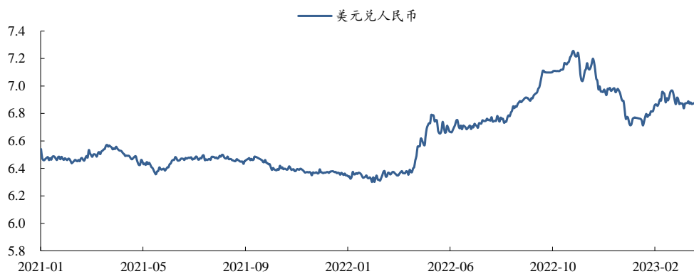
图2：2021年以来美元对人民币汇率走势