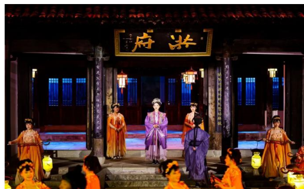
图 10: 《今夕共西溪》