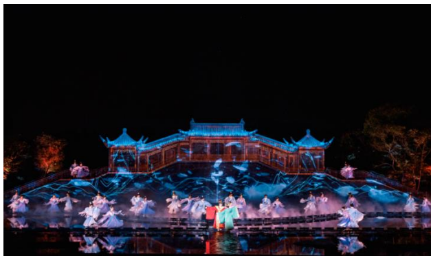
图 9: 《今夕共西溪》

《今夕共西溪》积极延伸“演艺+”产品链，在演出前增加由剧情延伸的宋韵游园，让游客在看戏之前，提前达到沉浸式的“入其梦、触其行、感其情”。打造多元化运营的“宋韵杭式生活体验基地”，构建一个有文化、有品位、丰富而多样的生活方式形态，促进宋韵杭式生活向参与化、互动化、情景化、趣味化等体验式方向发展。