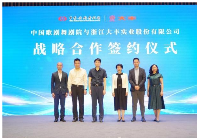
图 2：与中国歌剧舞剧院签署战略合作协议