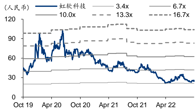
图表4: 虹软科技 PB-Bands