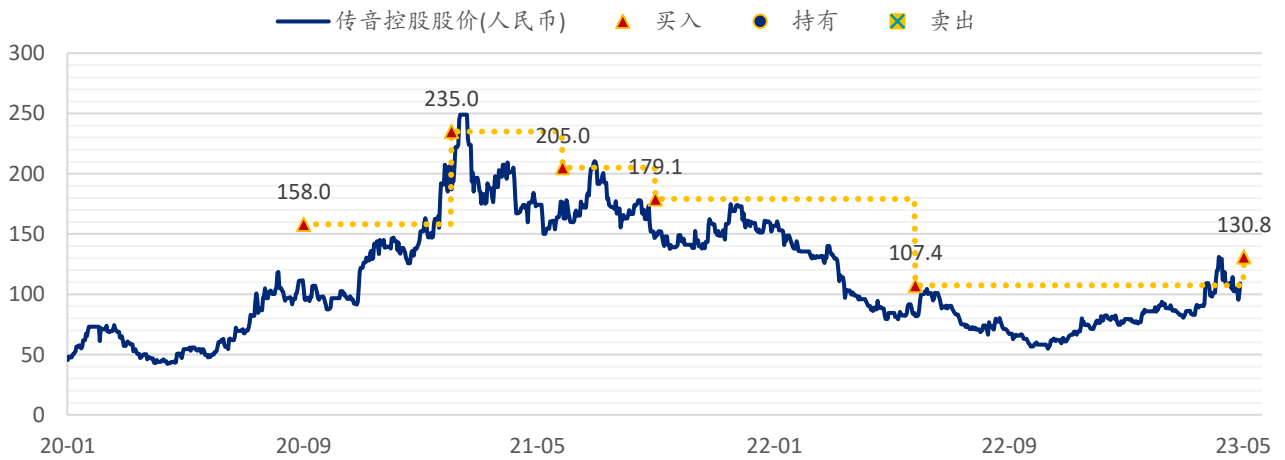
图表 8: SPDBI 目标价: 传音控股

注: 截至 2023 年 4 月 28 日收盘价