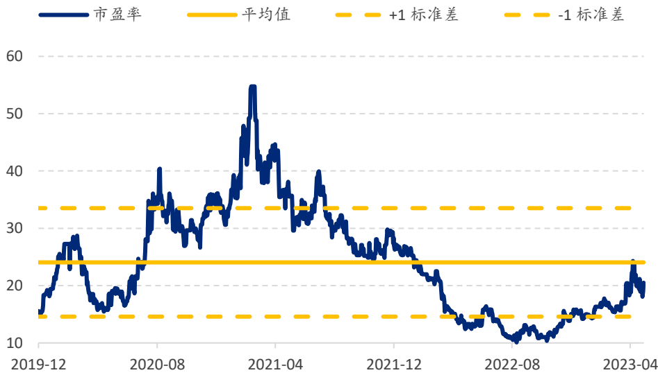
图表 7: 传音控股市盈率估值