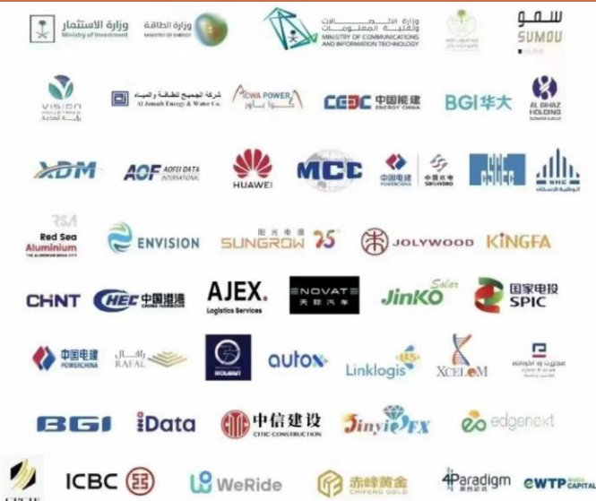
图 1: 中阿峰会 35 项合作签约方